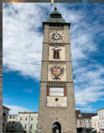
Über 150 Stufen, die sich lohnen – hinauf auf den Stadtturm von Enns.

den Frischekick in Seen, Flüssen und Bächen. Der Donauradweg, auch „Mutter der Flussradwege“ genannt, ist eine beliebte Route. Wie einst schon die Römer, später die sagenhaften Nibelungen oder sogar die mächtigen Könige und Kaiser Europas die Wege entlang der blauen Donau befahren – das hat schon was! Und einer der Reise-Höhepunkte ist sicher die Kulturstadt Linz mit dem Lentos Kunstmuseum, dem Brucknerhaus, dem Ars Electronica Center, der OÖ Landesgalerie, dem Schlossmuseum, dem Stifterhaus u. v. m. An der Donau gelegen ist